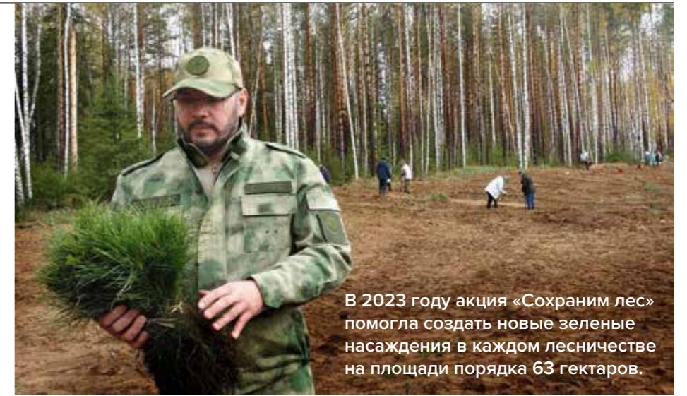
В 2023 году акция «Сохраним лес» помогла создать новые зеленые насаждения в каждом лесничестве на площади порядка 63 гектаров.

По статистике 2023 года, 71 процент возгораний на землях лесного фонда случились по вине человека. И с целью повышения уровня контроля территорий мы в этом году сделали упор на оснащение инспекторского состава новой патрульной техникой. Легковые автомобили повышенной проходимости в ноябре поступили в Балезинское, Вавожское, Глазовское, Камбарское, Можгинское и Сарапульское лесничества. Продолжим переоснащение инспекторской службы и в следующем году.