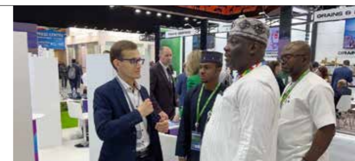
Концерн «Аксион» представил медицинскую технику на втором Саммите «Экономический и гуманитарный форум Россия – Африка», Москва, 2023 год.

представителей ведущих добывающих компаний и способен заместить иностранные аналоги, обеспечить потребности российского нефтегазового комплекса.