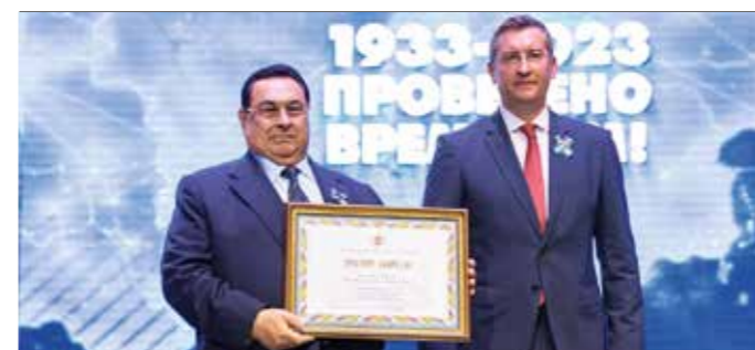
В честь 90-летнего юбилея более 600 сотрудников завода получили заслуженные награды. Коллектив предприятия награжден Почетными грамотами Правительства Российской Федерации, Совета Федерации, Роскосмоса.

Продолжено развитие производства лифтового и теплообменного оборудования. Среди продукции двойного назначения популярны автоматические системы управления и контроля безопасности, так необходимые отечественной сети железных дорог и авиаперевозок. Предприятия, входящие в Корпорацию «Аксион», выпускают линейку оборудования для стекольной и нефтяной отраслей промышленности. «Аксион» готовит серийное производство многофазных расходомеров – важнейшего нефтегазового оборудования, которое позволяет без применения радиоактивного излучения проводить анализ состава жидкости из скважины и при этом увеличивать выработку. Он получил высокую оценку