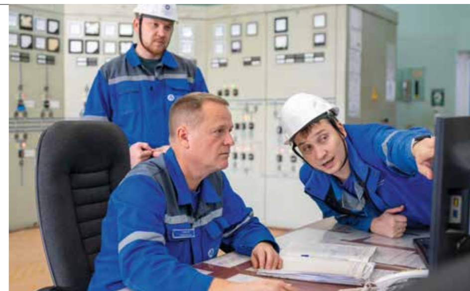
Внутренний вызов – формирование коллектива, задача была получить синергию от объединения 4-х предприятий, двух МУПов и двух коллективов атомной отрасли.

Наш человек – это тот, кто знает, для чего работает. Готов трудиться и в дождь, и