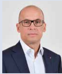
Глава Удмуртской Республики А.В. Бречалов