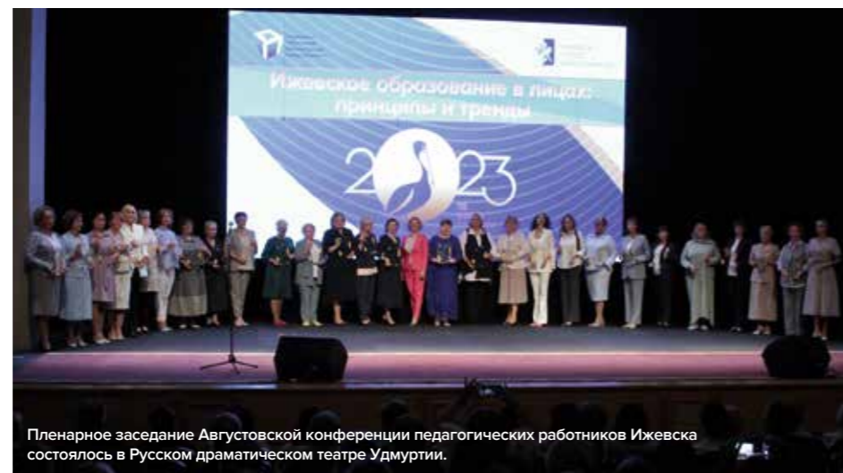
Пленарное заседание Августовской конференции педагогических работников Ижевска состоялось в Русском драматическом театре Удмуртии.

В заключение мне хотелось бы поздравить с началом нового учебного года всех коллег, которые трудятся в системе образования, как общего, так и дополнительного! Вы делаете одно общее дело, заняты воспитанием и развитием новых поколений жителей нашего города! Я желаю всем физических и духовных сил, здоровья и энергии, радости реализации себя в профессии и творчестве, исполнения всего намеченного, достижений учеников и побед воспитанников! ■