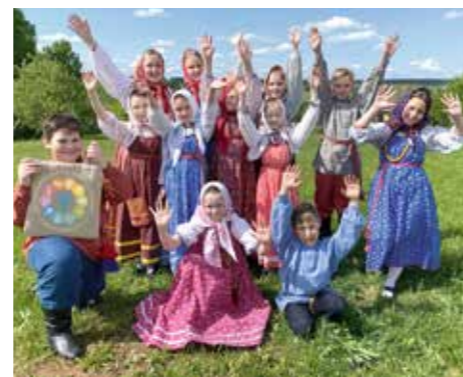
Фольклорный ансамбль «Колокольцы» – получатель гранта «Одаренные коллективы – 2023» от г. Ижевска

Наше ДО – это альянс неугомонного, дерзкого, мечтательного будущего нашей страны. И сегодня нам 30 лет! ■