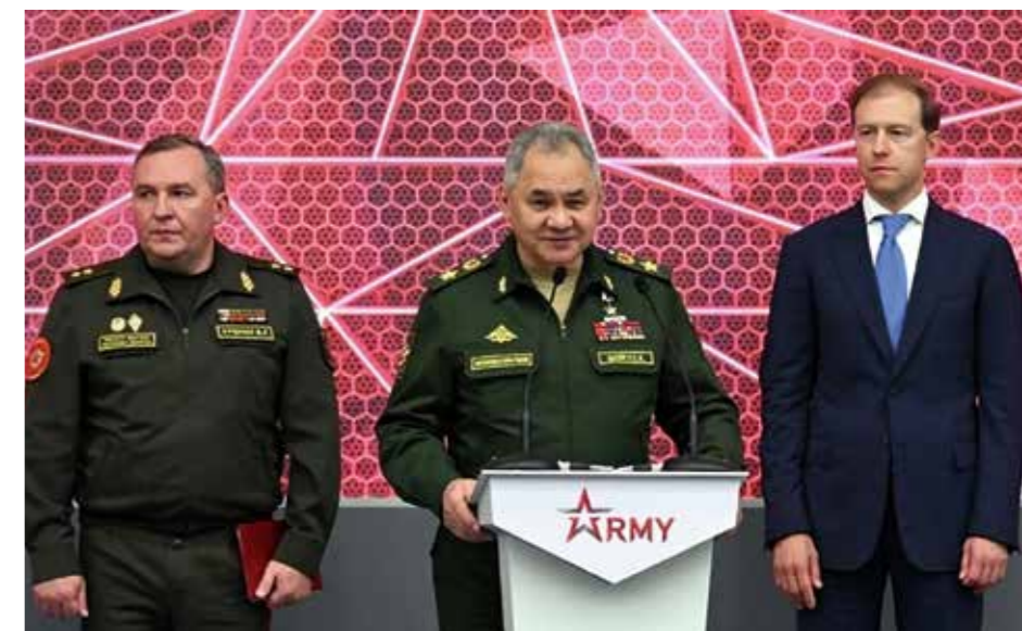
Сергей Шойгу: Приезд иностранных делегаций на форум «Армия-2023» – лучший ответ сторонникам санкций против России.

Участники форума смогли посетить экспозицию трофейного вооружения и техники, захваченных в ходе проведения специальной военной операции. Сама экспозиция была сформирована в августе 2022 года и за год существования она собрала более 870 образцов вооружения и военной техники. Большая часть экспонатов – вооружение и техника украинского